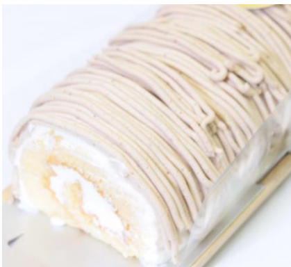
SWEET FACTORY Ange