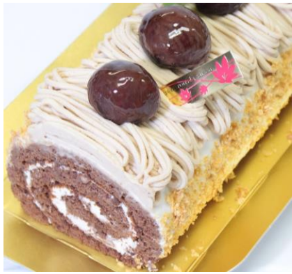
パティスリー・フランセ